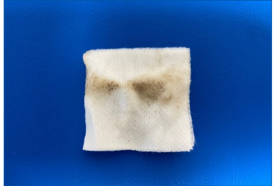
Figura 3. Limpieza con gasa de algodón impregnada en alcohol etílico