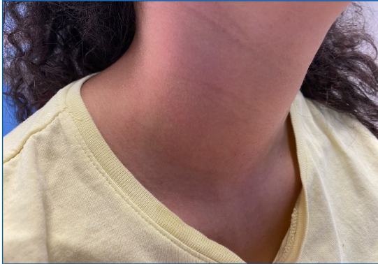
Figura 2. Tras la limpieza hay una desaparición total de las lesiones

cial con otras entidades como la papilomatosis, reticular, la pitiriasis versicolor, la acantosis nigricans o los nevus epidérmicos.